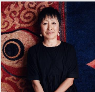
Billie Tsien 建筑师