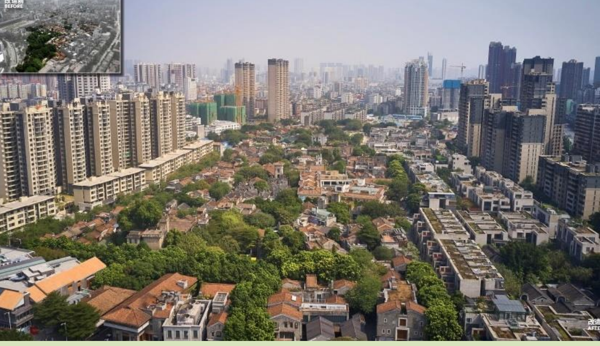
Foshan Lingnan Tiandi 佛山嶺南天地